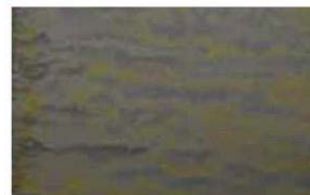
Resultados obtenidos después de 2 horas de tratamiento