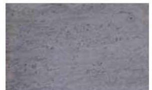
Resultados obtenidos después de 4 horas de tratamiento