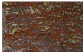
6 horas de exposición salina