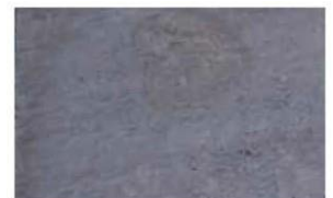
Resultados obtenidos después de 4 horas de tratamiento