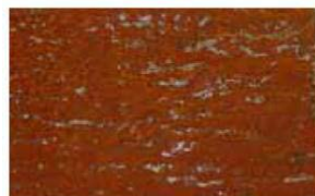
6 horas de exposición a la humedad