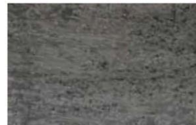
Resultados obtenidos después de 2 horas de tratamiento